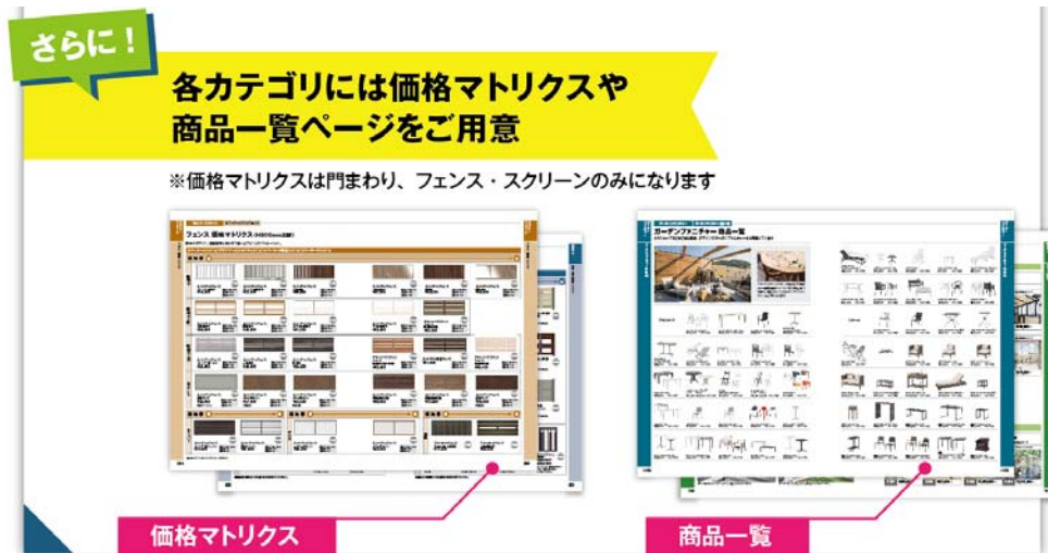
【商品一覧ページ・価格マトリクスページ イメージ図】

各主要カテゴリには、そのカテゴリ内の商品のデザインやカラーを一目で比べられるよう商品一覧ページを追加しました。また、一部カテゴリには価格マトリクスも作成し、価格も合わせて比較できるようにいたしました。カラー、デザイン、価格が一覧で表記されているため欲しい情報がパッと分かるようになりました。