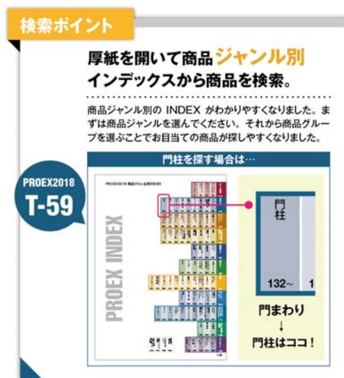
【ジャンル別インデックス イメージ図】

商品ジャンル別の INDEX を 11 のジャンル分けに変更いたしました。まずは、商品ジャンルを選んでいただき、そこから商品グループを選ぶことでお目当ての商品が探しやすくなっております。また、インデックスページを厚紙に変えたことでパツと開くことができます。