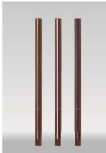
■格子材75角ライティングフェイス L2000 ¥59,500/本