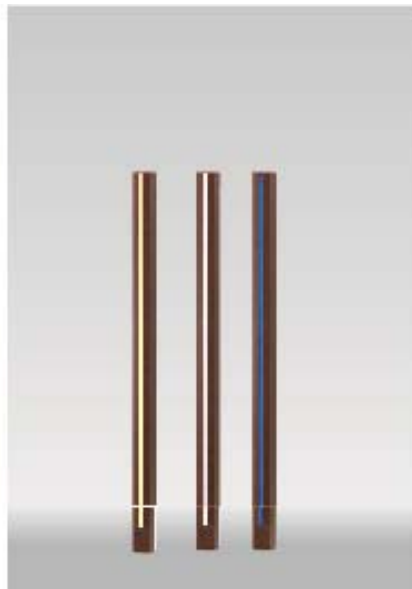
■格子材75角ライティングフェイス L1800 ¥58,000/本