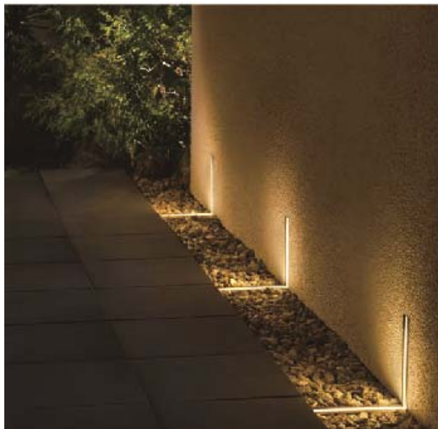
【ライティングフェイス 埋込タイプ 壁面・地面に埋め込んだ施工イメージ】