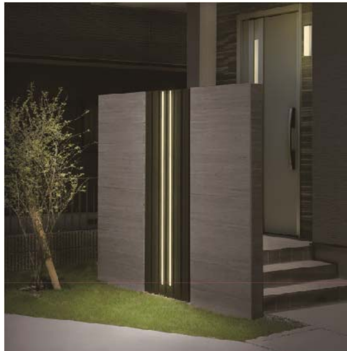
【ライティングフェイス 格子材 75 角 スリットフェンス使用イメージ】

ガーデンライフスタイルメーカーである株式会社タカショー（本社：和歌山県海南市、代表取締役社長：高岡伸夫、東証一部：7590）と、照明事業を担う子会社である株式会社タカショーデジテック（本社：和歌山県海南市）は、昨年の発売以降ご好評をいただいているライティングフェイスシリーズに、新しく『格子材 75 角』と『埋込タイプ』の 2 アイテムを追加、2 月より順次発売いたします。