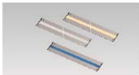
■ライティングフェイス埋込タイプ 190 ¥22,000/本

また、『格子材 75 角ライティングフェイス』に加えて、壁面や地面に埋め込み施工のできる新アイテム『ライティングフェイス埋込タイプ』も発売いたします。(4 月中旬発売予定) 器具長さは 190mm と 300mm。フレームタイプのライティングフェイスと同じ光色「電球色」「白色」「青色」をラインアップし、ライティングデザインの幅を広げます。