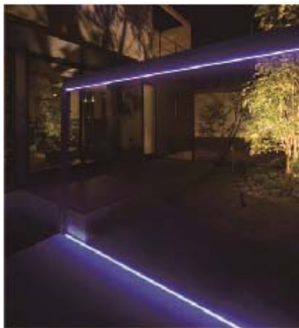
【ホームヤードルーフ®とライティングフェイス埋込タイプの組み合わせ施工イメージ】