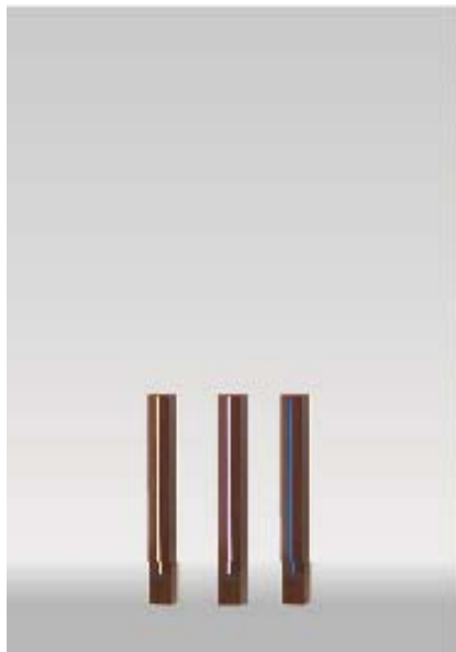
■格子材75角ライティングフェイス L850 ¥34,000/本

75 角のスリットフェンスに光のラインを加えるライティングフェイスです。見慣れたデザインのフェンスが、夜になるとガラリと表情を変化させます。長さは L2000(地上高 H1805)、L1800(同 H1605)、L850(同 H605) の3種類。それぞれにフレームタイプのライティングフェイスと同じ光色「電球色」「白色」「青色」とポール色「ダークパイン」「ブラックエボニー」「ブラウンエボニー」「京町家かきちゃ」を展開しています。