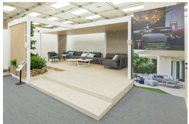
【展示ブース PIEDNUS classic (ピエニユ クラシック)】