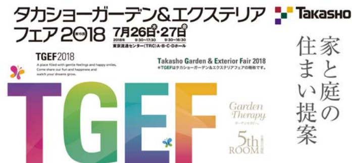
【TGEF2018 メインビジュアル】

ご来場者様の滞在時間も長く、各分野の有力会社様のご来場も目立って多く大変賑わいのある商談会となり、空間展示、新商品、パッケージ提案、緑、IT等を含め新しい情報をご覧いただきました。