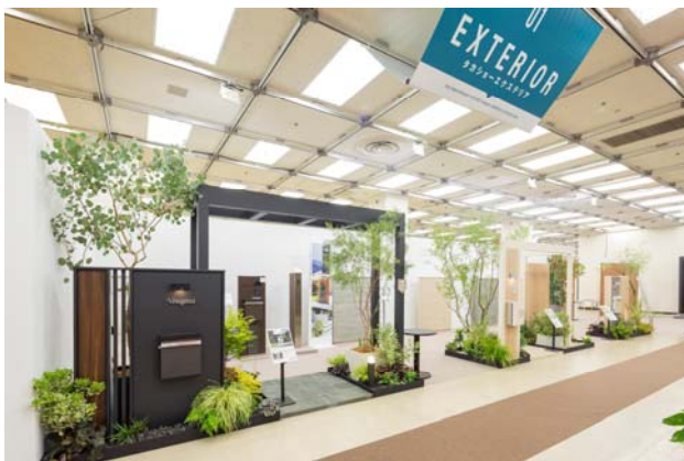
【展示ブース ファサードパッケージ】