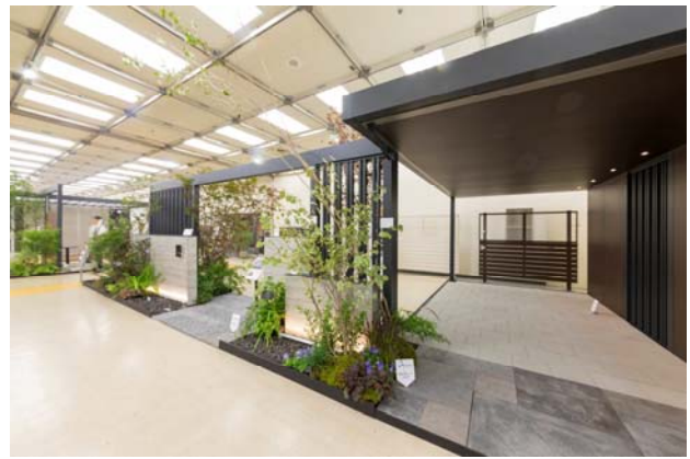
【展示ブース カーヤード提案】

『タカショーガーデン&エクステリアフェア 2018』では、お客様がお家とお庭を同時に設計・デザインを考えていただくことで、当社の強みでもある“やすらぎのある空間”が生まれること、またそれらが今後の日本人の生活やライフスタイルに影響してくることを、を問いかけさせていただきました。