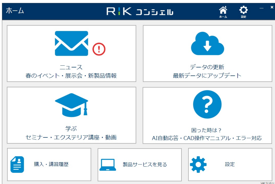
【「RIK コンシェル」ダウンロードサイト イメージ図】

http://www.rikcorp.jp/customer/support#rikconcier