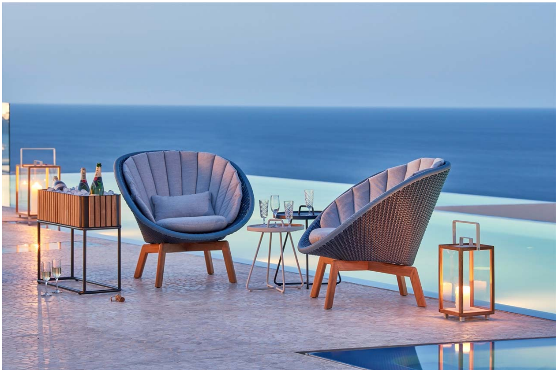
【『PIEDS NUS classic (ピエニクラシック)』ブランド 一部商品イメージ】

ガーデンライフスタイルメーカーである株式会社タカショー（本社：和歌山県海南市、代表取締役社長：高岡伸夫、東証一部：7590）は、屋外用ファニチャーのハイグレードタイプとなる『PIEDS NUS classic (ピエニクラシック)』ブランドを2019年3月21日（木）より展開いたします。