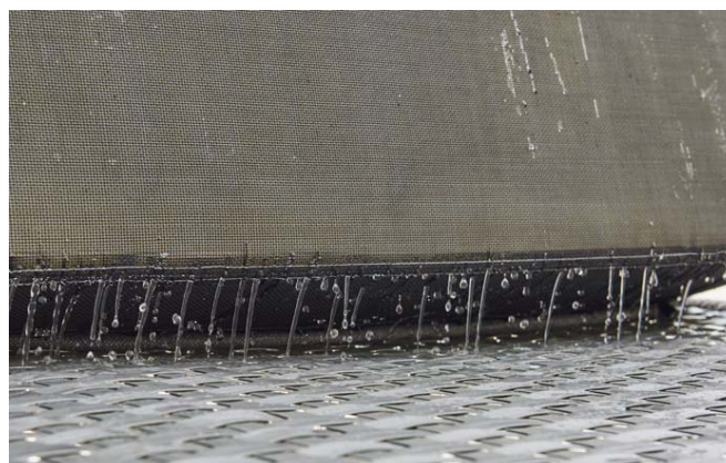
【QuickDry system (クイックドライシステム) イメージ】

※天候や使用環境によって異なりますので、必ず乾いたことを確認してからご使用ください。