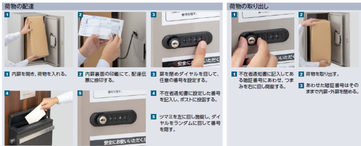
【荷物の配達・取り出し方法 説明イメージ】

す。また、荷物を取り出す際は、不在者通知書に記載された暗証番号にダイヤルを合わせ開錠すると、荷物を取り出すことができます。