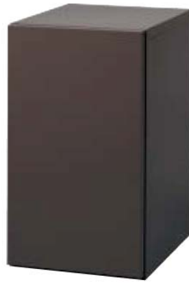
オールドブラウン