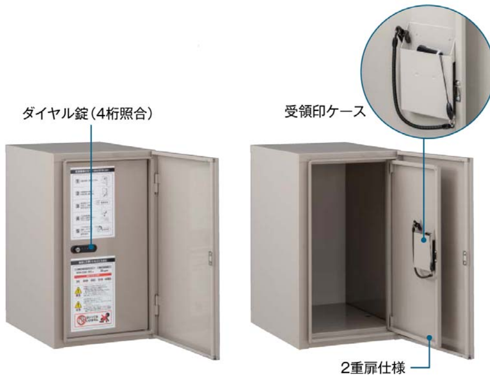
【『De-BOX』 二重扉構造 詳細イメージ】

扉を二重にすることで荷物の存在に気付かれにくく、セキュリティー面においても安心です。