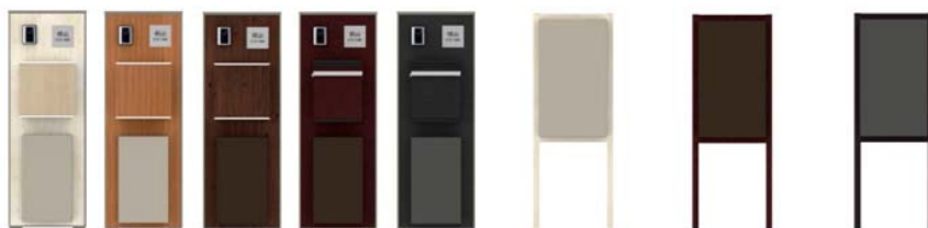
【『De-BOX』門柱・専用スタンド 詳細イメージ】