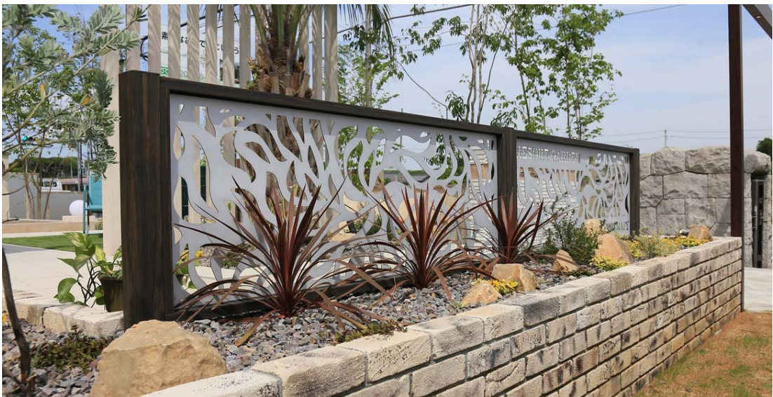
【デザインパネルⅡ 使用イメージ3】