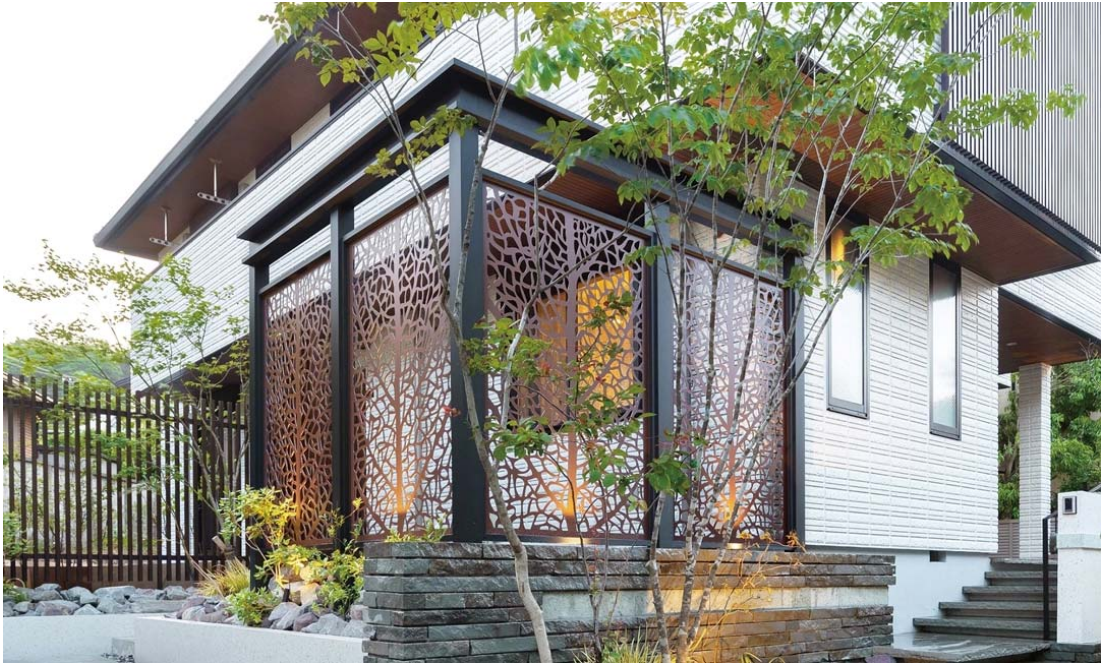
【デザインパネルⅡ 使用イメージ2】