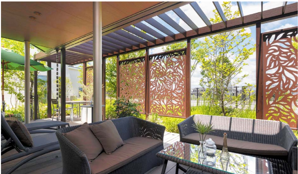
【デザインパネルⅡ 使用イメージ1】

ガーデンライフスタイルメーカーである株式会社タカショー（本社：和歌山県海南市 代表取締役社長：高岡伸夫 東証一部：7590）は、空間演出に最適な意匠性の高い模様が彫られた『デザインパネルⅡ』において、空間設計の幅をより広げていただける新たなデザインを2019年8月26日（月）より発売いたしました。