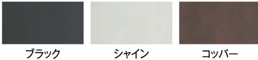
【デザインパネルⅡ カラーバリエーション】

色合いや質感にもこだわった3色をご用意しております。(表裏ともに同色) 表面がエンボス調となっており、高級感のある意匠パネルとなっております。 ※色合いに個体差が生じる場合がございます。予めご了承ください。